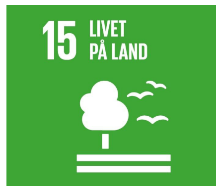
Mål 15: Livet på land