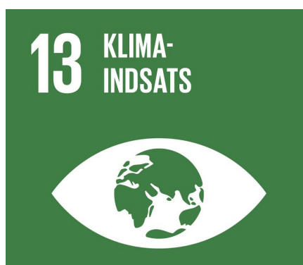
Mål 13: Klimaindsats