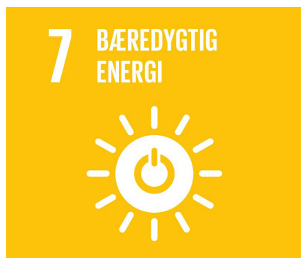
Mål 7: Bæredygtig energi