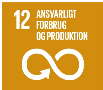
Mål 12: Ansvarligt forbrug og produktion