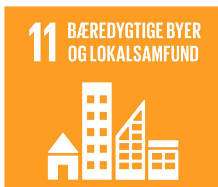
Mål 11: Bæredygtige byer og lokalsamfund